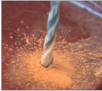
Keramická pálená střešní taška