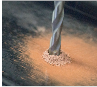
Glazovaná pálená střešní krytina