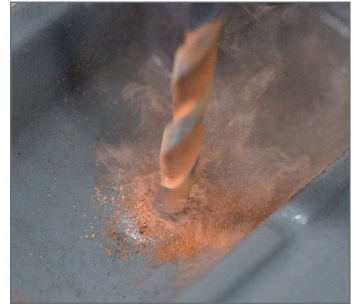
Engoba pálená střešní krytina